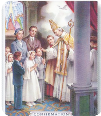
12.2 படம் ஆயர் உறுதிப்பூசுதல் வழங்குதல்